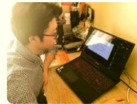
城市问题与城市更新