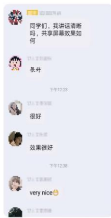
杨新军 陈佳 旅游地理与规划