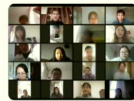
城市问题与城市更新