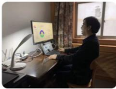
宋进喜 环境影响评价