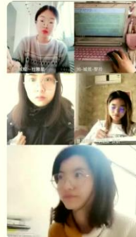
城市规划创新实践