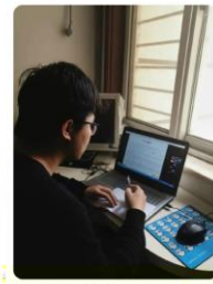
区域发展与规划研究专题